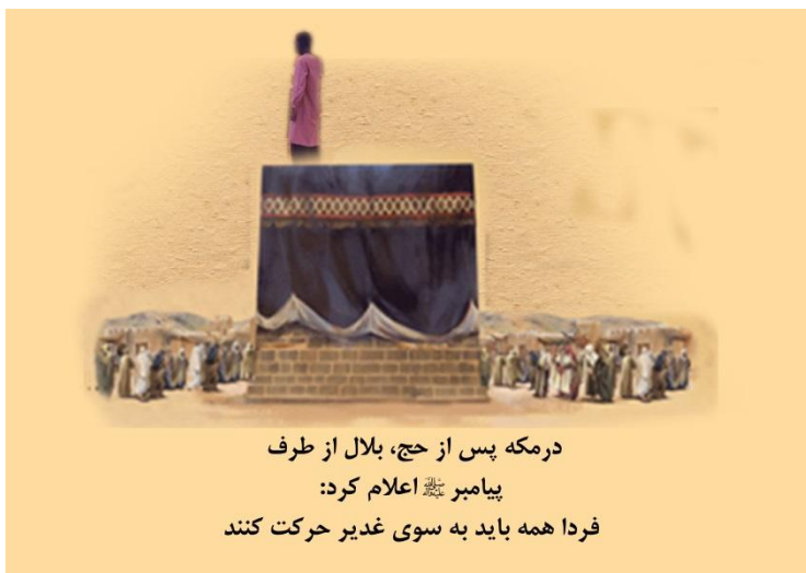
درمکه پس از حج، بلال از طرف پیامبر ﷺ اعلام کرد: فردا همه باید به سوی غدیر حرکت کنند