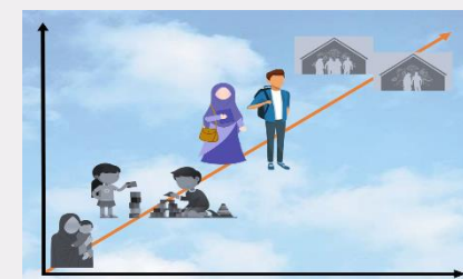
نگارش طرح مکتوب «نو-جوانی، اولوالفضل‌هایی در جامعه»