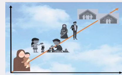
نگارش طرح مکتوب «طفل نوپای من»