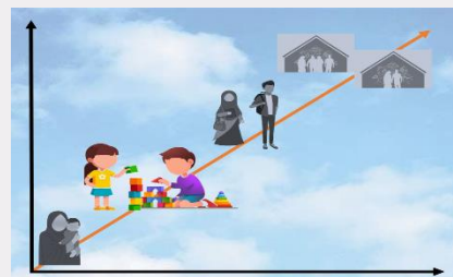
نگارش طرح مکتوب «کودک خیرگزین من»