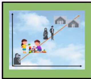
فرزند باعرضه من ۲ کودک خیرگزين من