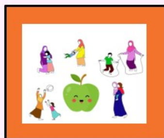
سلامت روحی و جسمی مادران