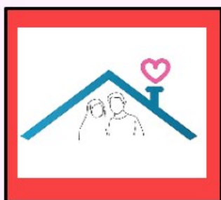
رحمت خدا در خانه ما