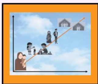
فرزند باعرضه من ۱ طفل نوپای من