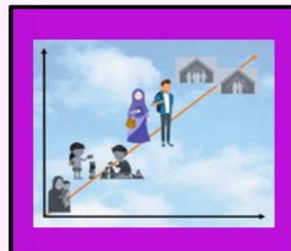
فرزند باعرضه من ۳ نو- جوانی؛ اولوالفضل‌هایی در جامعه