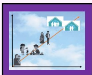
فرزند باعرضه من ۴ فرزند ایمان‌گزين من با توان عطف