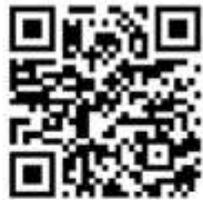
کانال زندگی توحیدی و خانواده توحیدی

غایت مدرسه خانواده به عنوان یکی از مدارس این مجموعه، تحقق و پیاده‌سازی قرآن و انجام فعالیت‌های قرآن‌محور در عرصه خانواده در همه عالم مبتنی بر نظام تدبیرمحور می‌باشد تا به این ترتیب اصلاح و ارتقای ظرفیت انسان‌ها و جامعه برای تجلی اسماء الهی و استقرار کلمه توحید در سرتاسر عالم، از هسته بنیادین اجتماع، یعنی خانواده، آغاز شود.